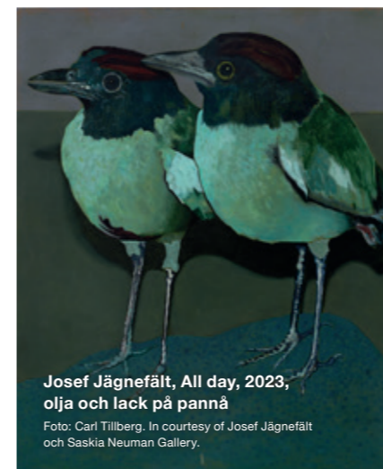
Josef Jägnefält, All day, 2023, olja och lack på pannå

Detaljerat program presenteras i februari!