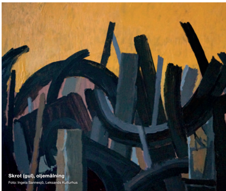
Skrot (gul), oljemålning