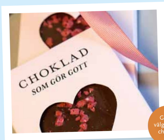
God & välgörande choklad

♥ CHOKLADFABRIKEN. Inför Alla hjärtans dag kunde vi tipsa om en extra god chokladkaka som Chokladfabriken hade tagit fram. Den finns att köpa både hos Chokladfabriken och hos Apotea och för varje såld kaka går fem kronor till Ersta diakonis arbete för människor i utsatta livssituationer.