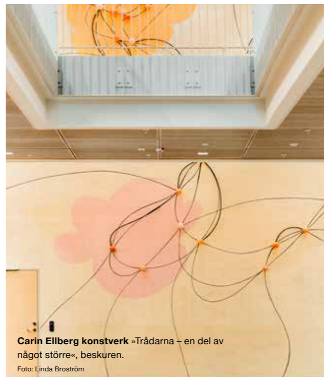
Carin Ellberg konstverk »Trådarna – en del av något större«, beskuren.