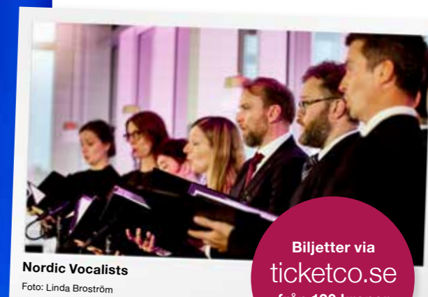
Nordic Vocalists

Biljetter via ticketco.se från 120 kronor