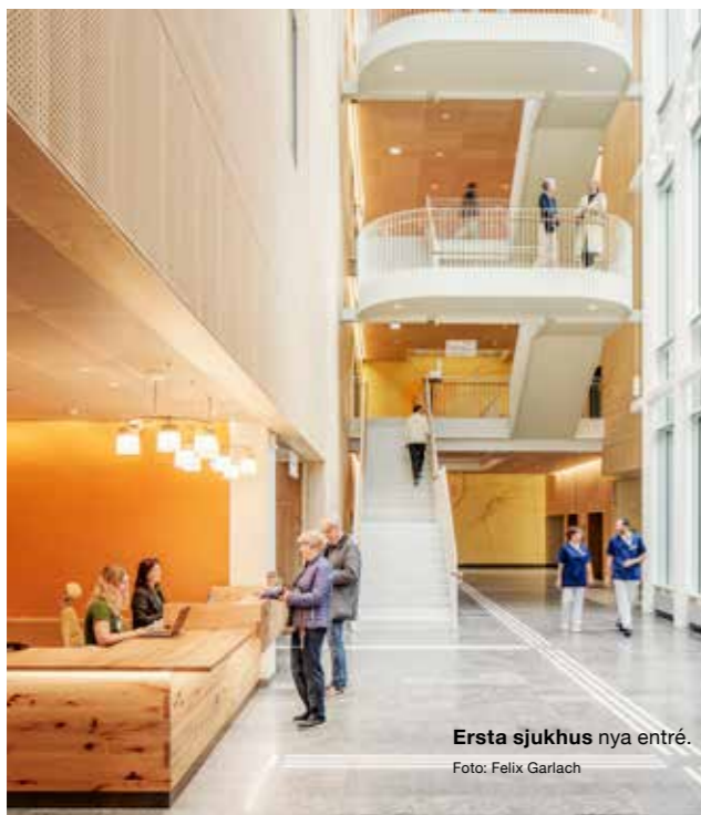
Ersta sjukhus nya entré.